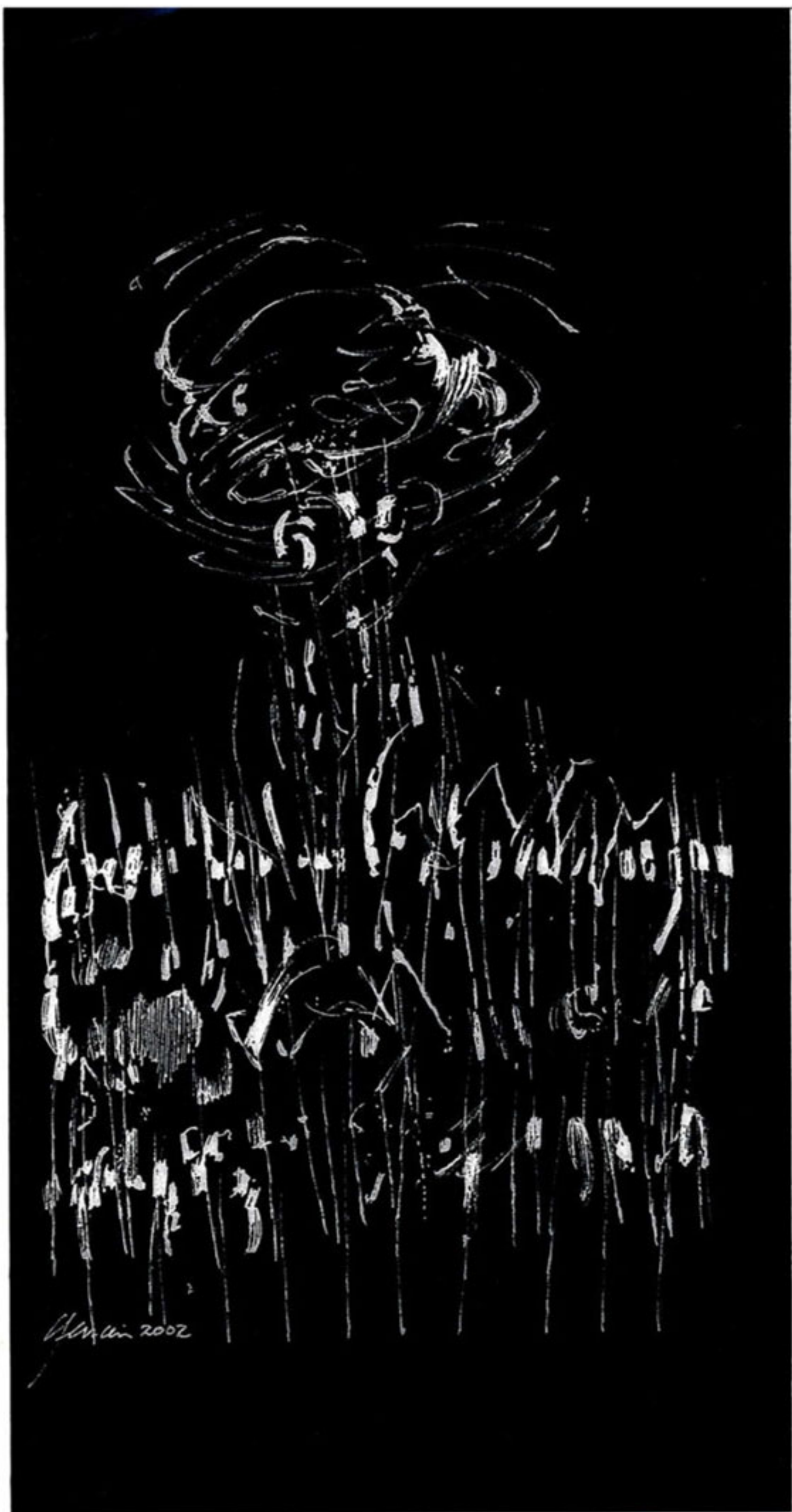
DESSIN POUR FRANÇOISE VEZINA (pages de garde)